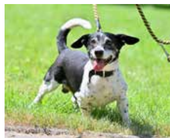
BENN / kříženec jezevčíka, 13 let, aktivní, vhodný k jednomu člověku do domu se zahrádkou

Naším úkolem je se psů vysvobozených z množírny ujmout, a v rámci možností, které jako úterek máme, udělat pro ně maximum tak, aby se dostali do fyzické i duševní pohody. Před nedávnem jsme přijali téměř dvacetičlennou skupinku psů malého plemene a jednoho psa velké rasy, byli odebráni z množírny. Přijali jsme vyděšené, zanedbané a špinavé psíky, kteří se v prvních dnech jen choulili k sobě navzájem. Báli se k nám přiblížit a při jakémkoliv manipulaci byli paralyzováni strachem. Po několika dnech již bylo patrné, že přichází úleva a strach přemohla zvědavost. Začali si užívat naši přítomnost, pohlázení,