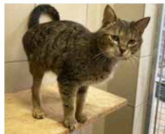
GULIVER / umazlený, zvědavý a vděčný kocour, 2 roky, kastrováný