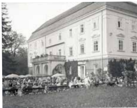
Zahradní restaurace u zámku ve třicátých letech 20. století

V souvislosti se soutěží na revitalizaci parku u zlínského zámku stojí za to ohlédnout se do jeho historie. Ta je spojena s existencí panského sídla, které západně od městečka Zlína vzniklo nejspíše ve druhé polovině 15. století zásluhou Víléma Tetoura z Tetova a na Zlíně. Šlo o tvrz, která byla až v pozdějších staletích přebudována na zámek.