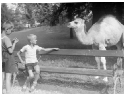
Oblíbený velbloud Pepíček

Pokračovaly také úpravy parku. Bouraly se cihlové zdi, upravovala zeleň a nové cestičky, instalovaly se lavičky.