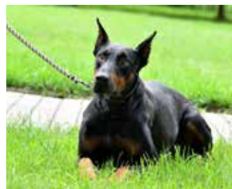
XENA / dobrmanka, 8 let, kastrováná, raději pro znalého pejskaře, na útulku čeká rok