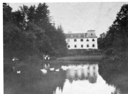
Rybník západně od zámku kolem roku 1900

Tak vznikla první zlínská zoo. Jejími dalšími obyvateli se stala dvojice tuleňů a několik dalších zvířat, která firma Baťa koupila v Hamburku. Osazení zahrady postupně tvořili dva mývali, osm papoušků, trpasličí indiští holubi, daňci, ohočený srnec, indické kachny, čínské labutě a holandské husy. Koncem ledna 1931 to bylo 43 zvířat.