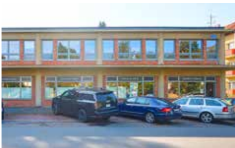
Benešovo nábřeží – po rekonstrukci