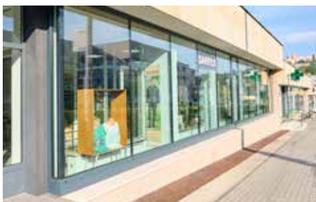
Dlouhá – po rekonstrukci

V případě Benešova nábřeží se po vyřešení vztahů s nájemci víceúčelového domu podařilo nejen rekonstruovat výkladce a okenní výplně, ale rovněž sjednotit označení provozoven tak, aby prostory nerušily reklamy a popisy. Město na jednotném označení spolupracova-