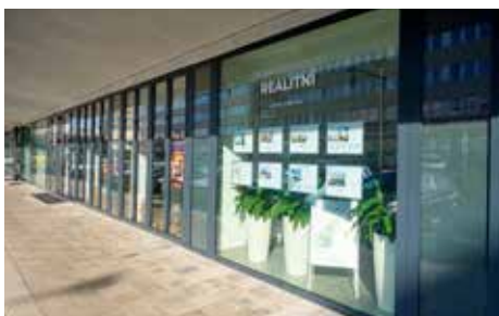
Kvítková – po rekonstrukci

prodejna Quitková spojující ateliér, obchod a výstavní prostor. Své působíště tady našla i realitní a advokátní kancelář nebo prodejna značkových vín a destilátů. Všechny prodejny mají jednotné vizuální označení, které navrhl Michal Jakubec z iniciativy Vizuální smysl Zlín. Město je rovněž před dokončením rekonstrukce obchodních prostor na ulici Dlouhá, kde před dvěma roky začala obnova dvou obchodních jednotek v domě s číslem popisným 94. Zde se jedná o soubor prodejen končící provozovnou společností Pohřebnictví Zlín, která na proměnu ještě čeká jako poslední.