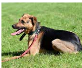
ARLO / drobný kříženec německého ovčáka, 3 roky, vhodný do bytu, do klidné rodiny