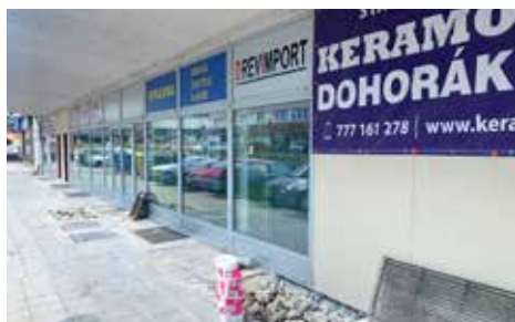
Kvítková – před rekonstrukcí