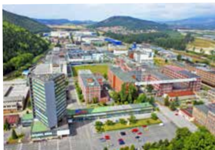
Areál Chemosvit

V červnu 1934 byly zakoupeny pozemky na břehu řeky Poprad pro výstavbu továrny na výrobu umělých vláken. Od září 1934 se rozbíhala zkušební výroba a v únoru 1936 začala průmyslová velkovýroba viskózního hedvábí pod značkou Svit. Postavení továrny a městečka bylo z ekonomického hlediska velkým přínosem pro chudý region pod Tatrami, kde bylo do té doby minimum průmyslové výroby a místní lidé se věnovali hlavně jednoduché zemědělské výrobě a pastevectví. V roce 1935 začalo budování rozsáhlého továrního areálu se skupinou velkých pětietážových budov a také výstavba obytných čtvrtí. Po třech letech výstavby, 1. května 1938, stálo na pozemcích deset nízkých továrních budov, jedna velká budova pětietážová, padesát rodinných domků, škola, obchodní dům a tři internáty. Celkem bylo mezi lety 1935 a 1945 postaveno 267 bytů, pro obyvatele firma postavila také závodní ambulanci, společenský dům, sportoviště, byla zde zřízena pošta a četnická stanice.