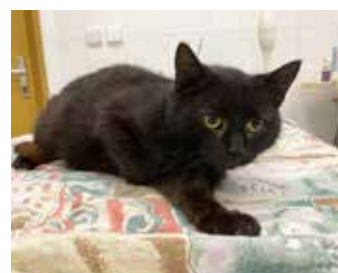
ŠPAGETKA / starší (8-9 let) kočička, klidná, čistotná, v útulku čeká rok (!)