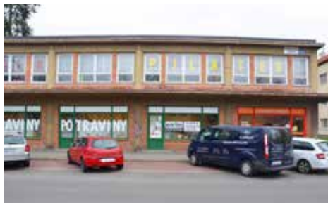
Benešovo nábřeží – před rekonstrukcí

lo s iniciativou Vizuální smysl Zlín. Dalším dokončeným projektem je rekonstrukce přízemní části bytového domu na ulici Kvítková 4122-24. Zde vzniklo šest nových jednotek, ve kterých sídlí například kadeřnictví nebo unikátní