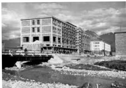
Hotel Spolcentrum*** Svit

Do kin v říjnu vstoupil nový český film Úsvit, který zajímavým způsobem otevírá dnes tolik diskutovaná genderová témata. Tuto debatu ale nechme stranou, nás bude zajímat zasazení příběhu do doby budování podtatranského baťovského města Svit.