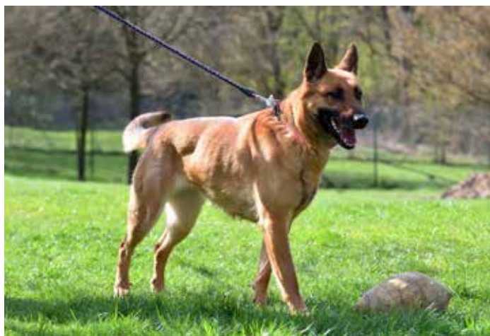
ARYA / fena x belgického ovčáka, temperamentní, hravá, 5 let, kastrovaná, vhodná pro znalce plemene

focení a grafickou úpravu fotografií chceme poděkovat Vítku Huspeninovi. Za grafické zpracování kalendáře a přípravu pro tisk děkujeme Janě Dosoudilové a Rostislavu Illíkovi z Fakulty multimediálních komunikací UTB ve Zlíně. Velké poděkování patří našim sponzorům, jejichž loga jsou viditelná na liště tohoto kalendáře. Jejich sponzorský dar byl použit pro celkovou úhradu tisku. Cena kalendáře zůstává stejná, 180 Kč. Jednotlivá prodejní místa našeho kalendáře budou průběžně zveřejňována na našem webu, Facebooku a Instagramu „Útlek Zlín“. Je také možnost napsat nám na e-mail utulekzlin@utulekzlin.cz a my vám kalendář rádi zašleme. Doufáme, že i vám bude náš kalendář dělat radost celý příští rok. /red/