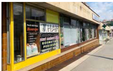
Dlouhá – před rekonstrukcí

Benešovo nábřeží, ulice Dlouhá a Kvítková. Statutární město Zlín podniklo první tři významné kroky ve snaze omezit vizuální smog a sjednotit vizuální styl všude tam, kde nejrůznější formy reklamy buď ruší, nebo hzdí architekturu domů.